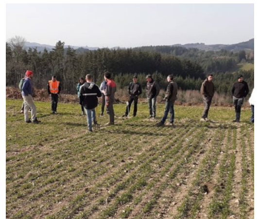
Visite du 26 février dernier. Les agriculteurs présents ont pu échanger avec les techniciens sur le choix des céréales, la fertilité, la stratégie de désherbage, le sol et les techniques de semis,... Cela a également été l'occasion de voir fonctionner une herse étrille.