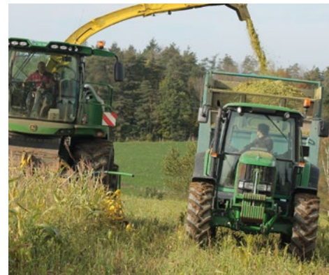
Récolte ensilage de la parcelle dérobée "maïs-sorgho-pois-vesce"

En 2020, le suivi a porté notamment sur la conduite d'une culture dérobée à base de maïs - sorgho - vesce - pois, implantée début juillet après la moisson d'une orge d'hiver, sur une parcelle de 5 ha. Une visite de la parcelle d'essai, rassemblant une vingtaine d'agriculteurs, a été organisée le 18 août 2020. L'estimation du rendement a été réalisée au moment de la récolte en ensilage, le 15 octobre.