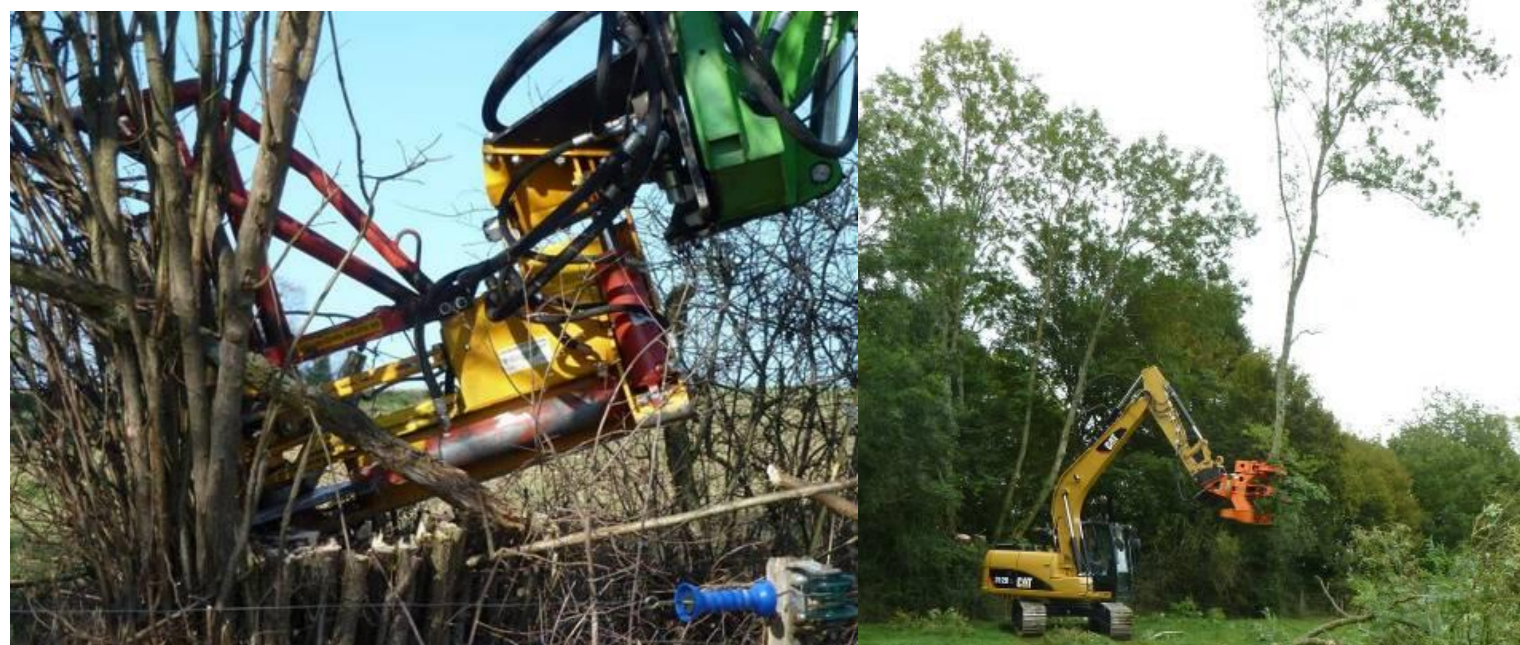
Coupe d'une cépée (brassée) de noisetiers

Un chantier de déchetage doit être organisé pour être rentable