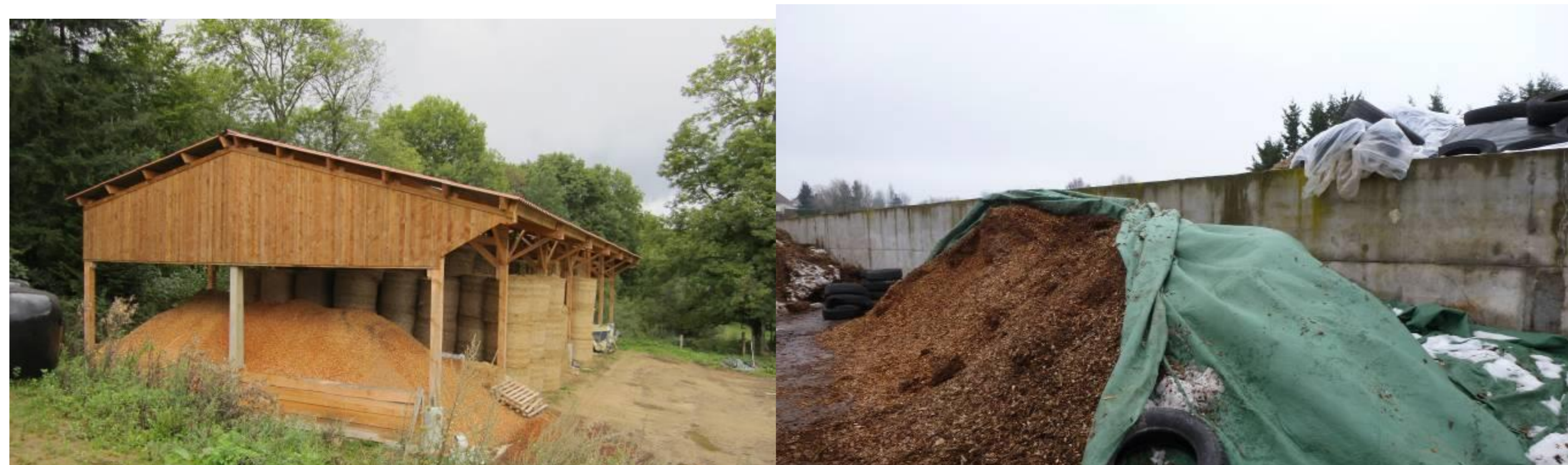
Stockage en bâtiment abrité : idéal pour le bois énergie.

→ en tas en dôme, si possible en local abrité et aéré.