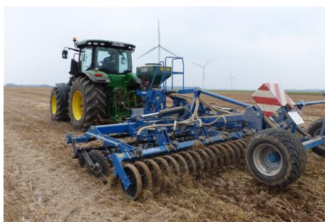
Semis à la volée avec distributeur (type Delimbe) sur déchaumeur : attention, petites graines uniquement !