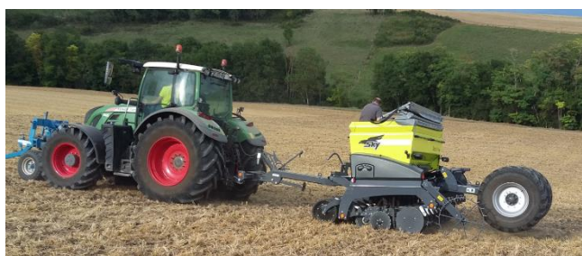
Semis direct à disques : possibilité d'utiliser les différents compartiments pour semer des graines plus grosses (comme la féverole), ou de tailles différentes